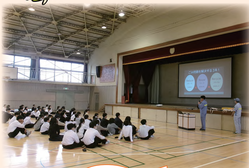
中学校で実施した環境学習の様子